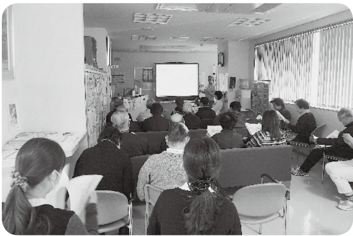
会場となった診療所の外来はいっぱい

世帯、そのうち900世帯分を62名の手配り者が配布しています。 暑い日も寒い日も一軒一軒ニュースを配り、時には近況を伺ったり、診療所への要望をお聞きすることもあるそうです。自分自身の健康のために手配りを続けている人が多く、中でも80歳の女性の「毎日ラジオ体操を欠かさず足腰を丈夫に保ち、いつまでも元気でいられることこそが、お金儲け」との言葉には、誰しもが大きくうなずきました。 今、ますます窮屈で息苦しく感じられる世の中にあって、この夕陽ヶ丘診療所がホッと一息つけるオアシスのような場所であって欲しいと願っています。 (篠原希代子)