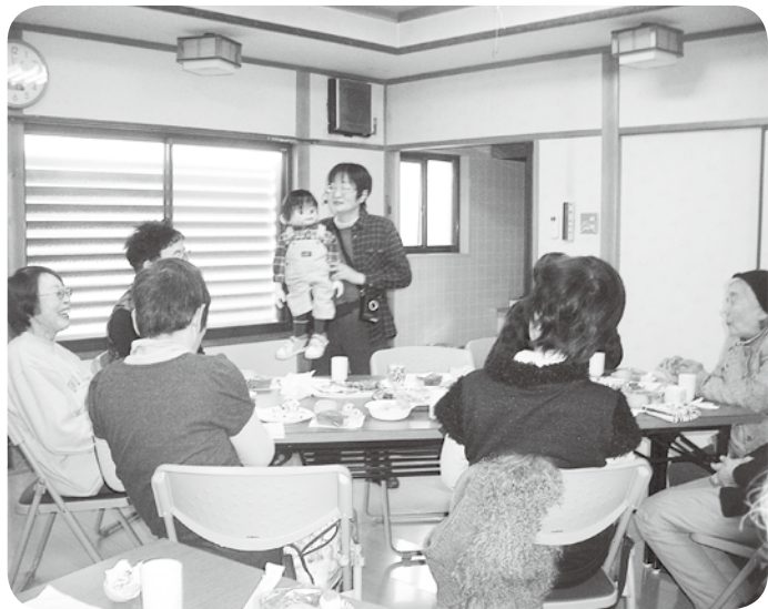
腹話術を披露して下さっているのも「手配りさん」です

今にも小雪が散らつきそうな寒い中、日頃「夕陽ヶ丘ニュース」を手配りして下さる方達を招いて懇親会が開かれました。この日のために、前日からわざわざ手作りされたおかしや可愛い雪ダルマの和菓子、そして、香ばしいケーキなど盛りだくさんのご馳走をほおばりながら、お話を伺いました。 現在、夕陽ヶ丘健康友の会員は約1030