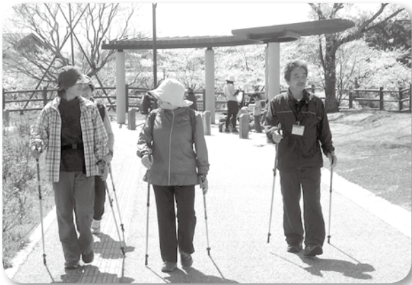
春は花や新緑を楽しみながら歩きます。

最近まちなかでよく見かけるようになった「ノルディック・ウォーキング」。2本のポールを手に持ち、リズムカルに歩きます。下半身だけでなく上半身も動かすため、普通のウォーキングよりも約1.2倍のカロリー消費の効果があるそ