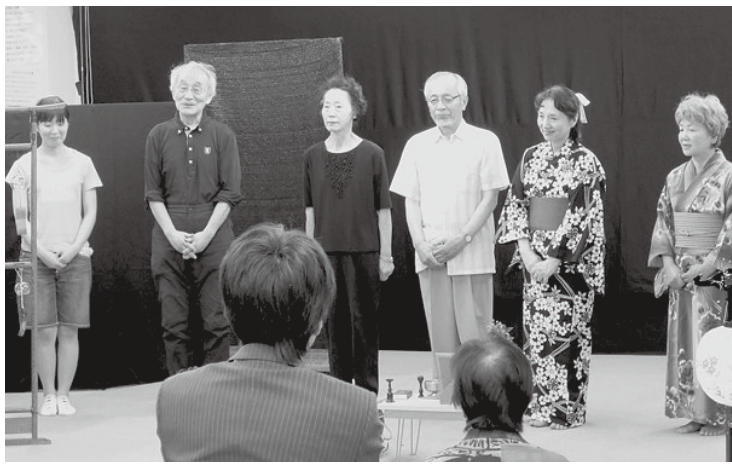
（生駒支部・船越 郁）

戦後60年、お盆になると必ず西瓜を持ってお参りに来る元軍人。彼は、戦地に送られてきた「慰問袋」に入っていた写真の娘さんに憧れ、是非結婚したいと訪ねて来ましたが、彼女は終戦前日の8月14日、大阪京橋の空襲で亡くなっていました。彼女の大好きだった父親の作った風鈴をお盆に飾っていた母親も亡くなってしまい、今は嫁とその娘（孫）が、やはり風鈴を飾っています。そして今年もまた、彼は自分の作った一番立派な西瓜を持って訪れます。そんな彼を二人の幽霊はわくわくして待っています。勿論彼には見えません。現代っ子の孫が彼を